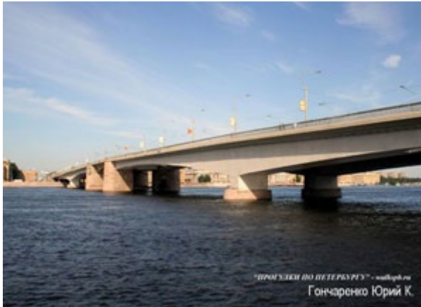
Мост Александра Невского