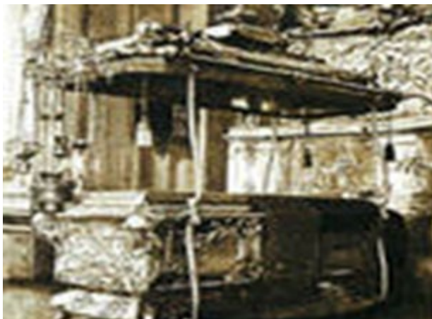
Мо́щи Алекса́ндра Не́вского 2